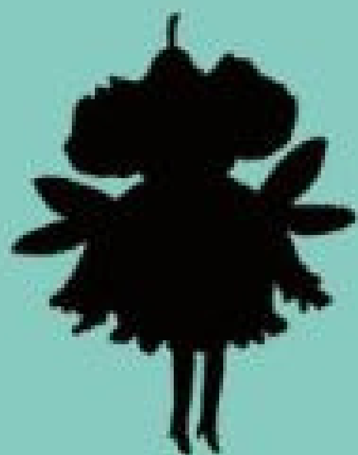
FIFAILLE, UNE FÉE MALADROITE