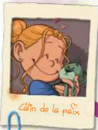
Câlin de la paix