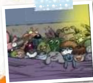
Kro mimi, mes peluches

Depuis que je suis la grande, mon journaloulou, j'suis trop n'intelligente!