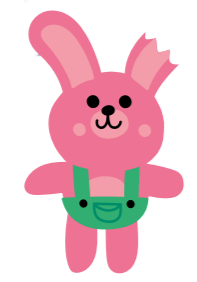
le doudou de Rosalie