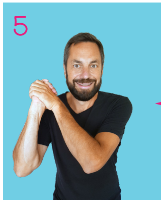
Le balançait de-ci de-là

(Les mains jointes passent sur l'épaule droite puis l'épaule gauche, plusieurs fois, dans un mouvement de balancier)