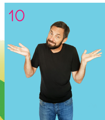
Tant pis !