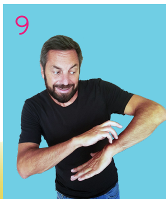
Il est parti