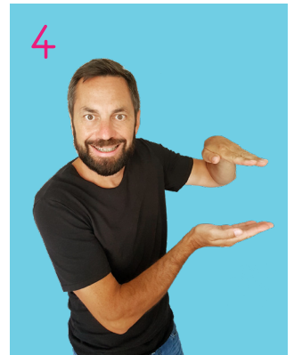
...tout petit !