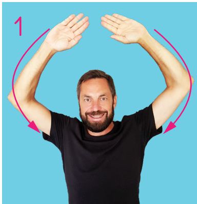
Dans la forêt