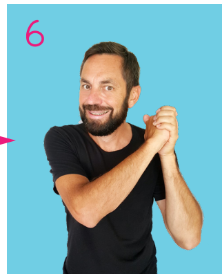
Hop là, hop là !

(Les mains jointes passent sur l'épaule droite puis l'épaule gauche, plusieurs fois, dans un mouvement de balancier)